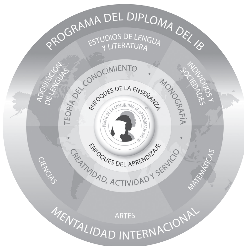
Figura 1 Modelo del Programa del Diploma

El programa se representa mediante seis áreas académicas dispuestas en torno a un núcleo (véase la figura 1); esta estructura fomenta el estudio simultáneo de una amplia variedad de áreas académicas. Los alumnos estudian dos lenguas modernas (o una lengua moderna y una clásica), una asignatura de humanidades o ciencias sociales, una ciencia, una asignatura de matemáticas y una de las artes. Esta variedad hace del Programa del Diploma un programa exigente y muy eficaz como preparación para el ingreso a la universidad. Además, en cada una de las áreas académicas los alumnos tienen flexibilidad para elegir las asignaturas en las que estén particularmente interesados y que quizás deseen continuar estudiando en la universidad.