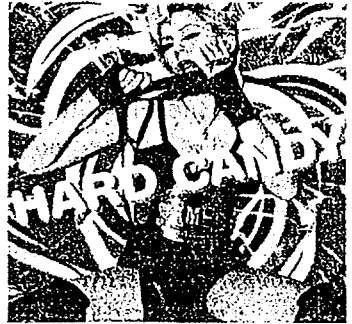
FIG. 4. IMAGEN PROMOCIONAL DE LA CANTANTE MADONNA PARA SU DISCO HARD CANDY . IMAGEN POSMODERNA. POR LO TANTO, ECLÉCTICA. MESTIZA. FRUTO DE LA DOBLE CODIFICACIÓN COMO DEMUESTRA QUE DENTRO DEL MISMO MENSAJE APARECE UNA CRUZ CRISTIANA COLGANDO DEL CUELLO DE LA PROTAGONISTA. LA CUAL SE EXHIBE EN UNA CLARA POSTURA SEXUAL.