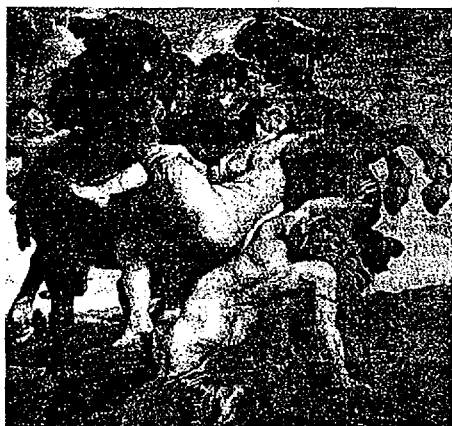
FIG. 2. RUBENS. EL RAPTO DE LAS HIJAS DE LEUCIPO (HACIA 1616).

En la figura inferior tenemos una obra de Rubens utilizada en muchos libros de texto y por muchos docentes para explicar la