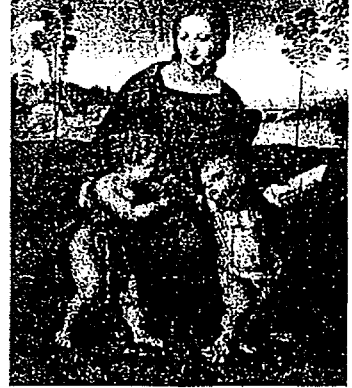
FIG. 3. RAFAEL. MADONNA DEL JILGUERO (1505-06). IMAGEN PREMODERNA.

Que los estudiantes aprendan a apreciar la doble-codificación es otra de las grandes propuestas de la Educación Artística Posmoderna. Que aprendan a interesarse por lo feo que quizás sea